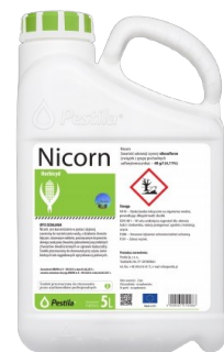
Nicorn 040 S.C. Pestila