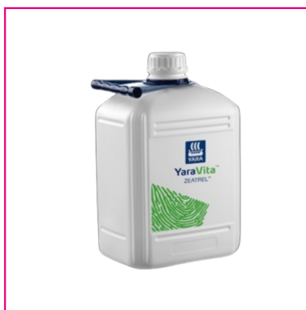
YARA Vita Zeatrel YARA