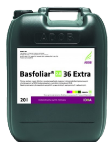
Basfoliar 36 EXTRA ADOB