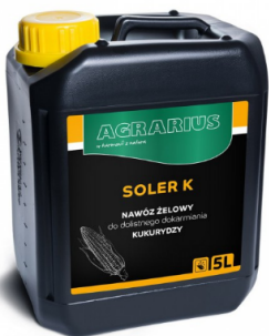
Soler K AGRARIUS