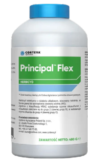
PRINCIPAL FLEX Corteva