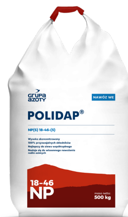
Polidap Grupa Azoty