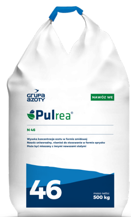
Pulrea + INU Grupa Azoty